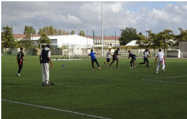
Les apprenants des centres de formation jouant au football.

Se vider la tête, s'amuser, se dépasser. C'est ce que propose Le Havre en Forme grâce à son programme « Mon Coach sportif ».