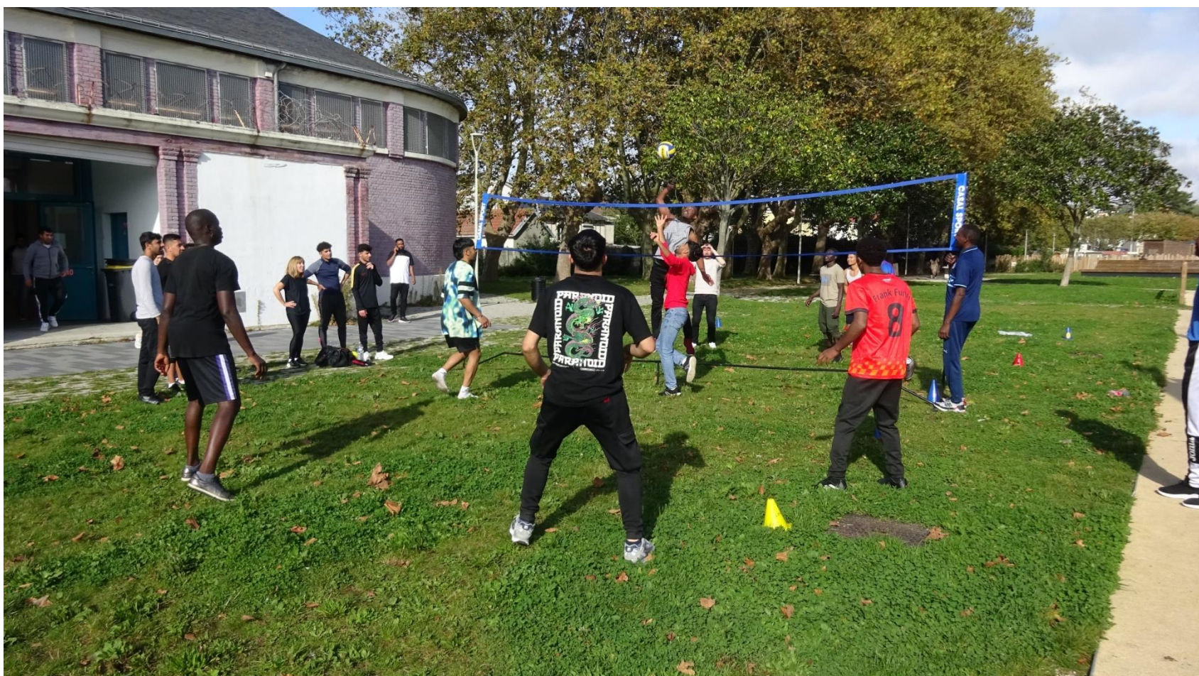
Match de volley à la salle Le Bourvellec, avenue Tréfileries au Havre – quartier sud.