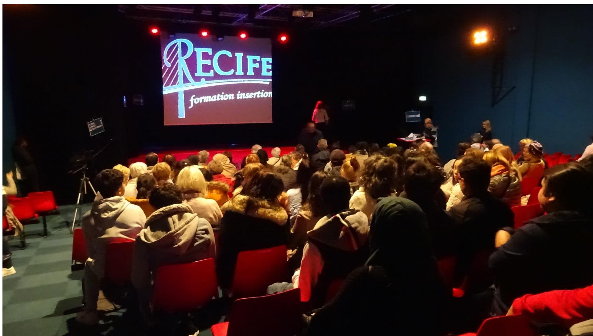
Représentation théâtrale organisé par Recife.