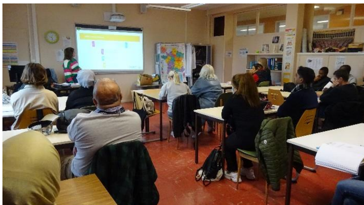
Intervention de l'IRSA. Institut Régional pour la Santé, 160 rue Massillon, Le Havre

L'intervenante est venue présenter les prestations de l'institut auprès de public primo-arrivant. Elle a expliqué l'histoire de l'IRSA et définit ce qu'est un médecin traitant et surtout, comment en trouver un. Elle a également décrit leurs services de prévention et de recommandation, notamment l'orientation vers des spécialistes.