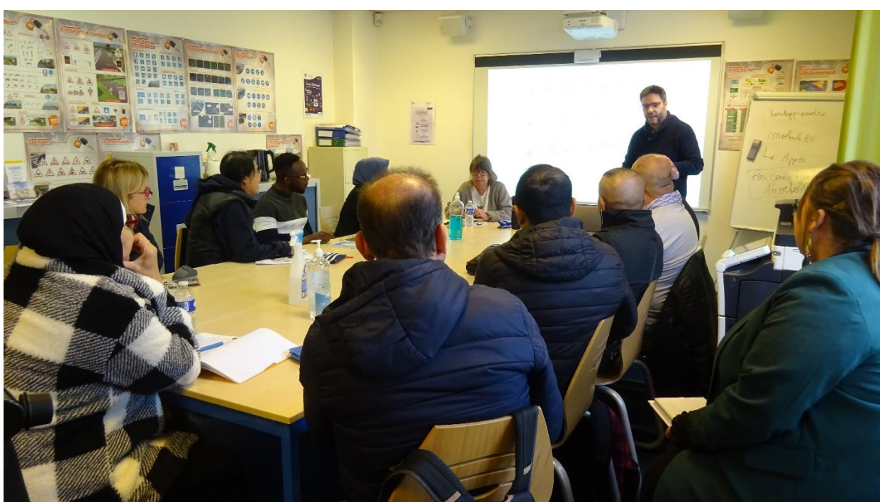
Le Pôle Mobilité – Fodeno, 120 rue Jules Siegfried-76600 Le Havre